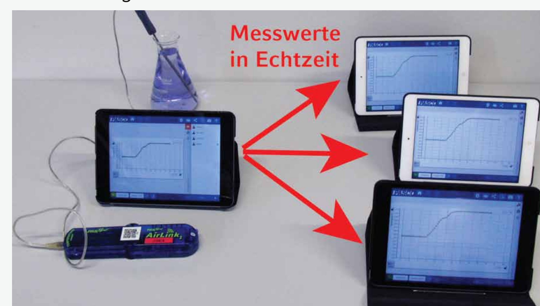
Abb. 5: Messwertübertragung in Echtzeit mittels Shared Sessions in SparkVue von Pasco

Eine Auswertung direkt im Messwerterfassungsprogramm (gemeinsam oder individuell) bietet i.d.R. sehr viel strukturelles Scaffolding. Die Software hat aber nur geringen Lebensweltbezug. Eine Alternative bieten Tabellenkalkulationsprogramme, die vielfältige Einsatzmöglichkeiten bieten. Der höheren Komplexität dieser Programme durch den erweiterten Funktionsumfang kann dabei bspw. durch Peer-Scaffolding per Echtzeitkollaboration begegnet werden. Viele wichtige Programme wie Excel, Numbers oder Google Sheets bieten diese Funktionalität.