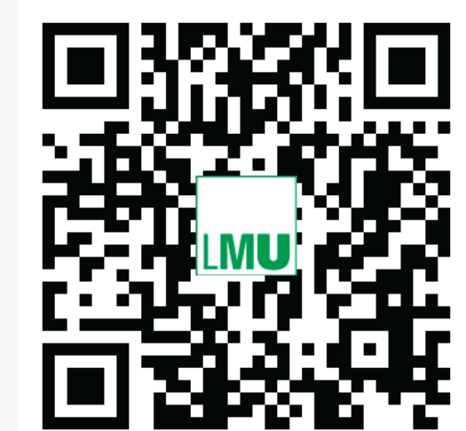
Abb. 4: Link zu Live-Demo (https://pollev.com/richtberg)